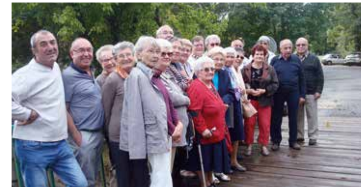
Sortie du Cercle de l'Amitié au Moulin de Duellas en Dordogne

Progressivement, les activités du cercle de l'Amitié reprennent et des innovations sont proposées . Les sorties sont très appréciées. Après « Les jardins de Sardy », « Le Moulin de Duellas », « L'Ange Bleu », le programme se poursuit et se diversifie . Si vous êtes intéressés, venez rejoindre le groupe qui se réunit le 1er mardi de chaque mois à 14h à la salle polyvalente de Petit-Palais et Cornemps .